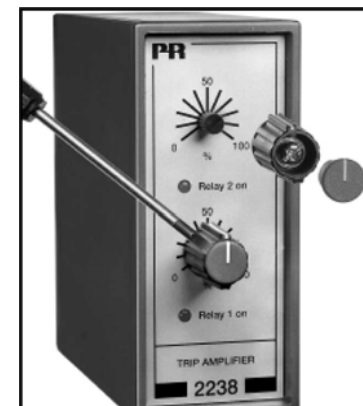
Рис. 2: Снятие поворотных ручек